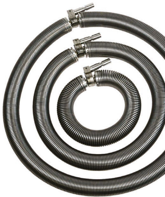
Gördülő rugóspirál elektródák