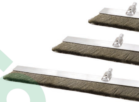
Lapos drótkéfe elektródák

A DeFelsko adapterek segítségével más gyártók rugós és kefes elektródái is használhatók